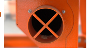
ÖFFNUNG FÜR STAUBABSAUGUNG