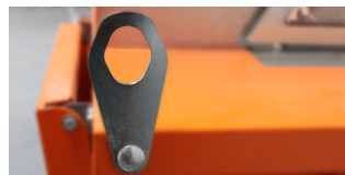
4 EINKLAPPBARE KRANTRANSPORTÖSEN