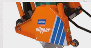
ANSCHLUSSMÖGLICHKEIT FÜR STAUBABSUGUNG

WIR EMPFEHLEN DEN EINSATZ FOLGENDER DIAMANTSCHLEIBE FÜR CS 451 E & ET