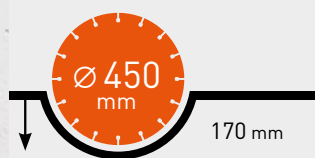
MAX. SCHNITT-TIEFE CS 451 E