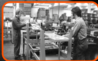
Productie van Clipper-steenzaagmachines in Bascharage, Luxemburg, in de jaren zestig.

Norton Clipper was een pionier op het gebied van het zagen van steen, baksteen en beton met de uitvinding van de eerste steenzaagmachine. Sindsdien hebben we de technologie voortdurend verbeterd.