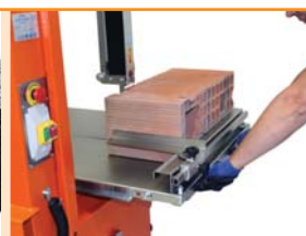
Sicher in der Anwendung