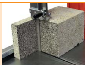
Präzisionsschnitte für alle Anwendungen