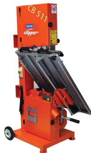
Abmessung mit eingeklapptem Schneidtisch (Transportstellung) 1050 x 900 x 1840mm