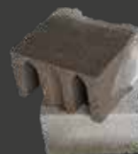
Hålsten i betong