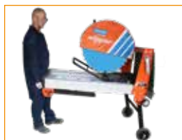
ENKEL ATT TRANSPORTERA