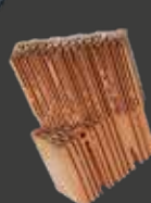
Isolersten i tegel