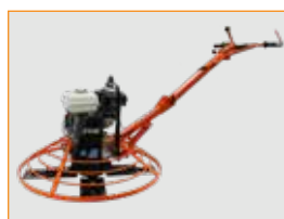
ROBUST OCH PÅLITLIG