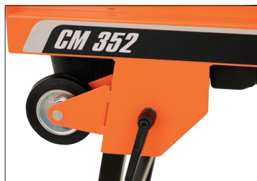
Transportrollen für mehr Komfort