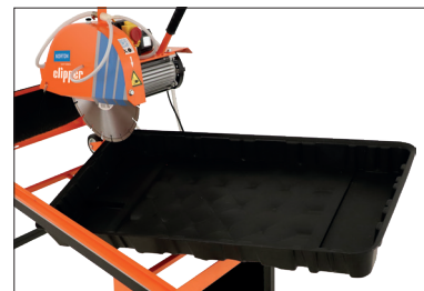
Leicht herausnehmbare Wasserwanne