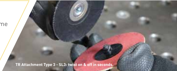
TR Attachment Type 3 - SL3: twist on & off in seconds.

NORTON RAZORSTAR® R990S HIZLI DEĞİŞİM DİSKLERİ