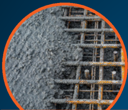
BETON EN GEWAPEND BETON