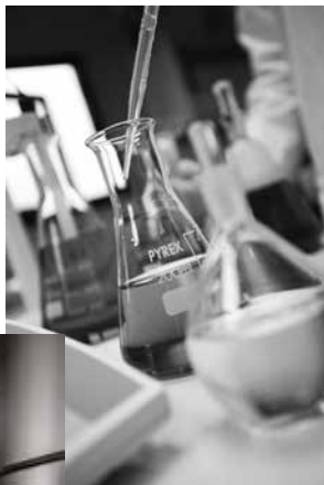
Foto 1: Laboratorium firmy i obiekty testowe

Farécla Products Ltd, firma z siedzibą w Wielkiej Brytanii należąca do Grupy Saint-Gobain, produkuje środki do wykańczania powierzchni, które są stosowane na szerokiej gamie podłoży w wielu sektorach rynku. Od past polerskich i aplikatorów, po kubki do malowania, ściereczki z mikrofibry i inne akcesoria warsztatowe, Farécla dostarcza rozwiązania do wykańczania powierzchni do warsztatów samochodowych, serwisów detalingowych, stoczni, stolarzy, producentów kompozytów i GRP od 1952 roku, a jej produkty są obecnie sprzedawane w ponad 120 krajach na całym świecie.