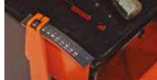
KESME DERİNLİK GÖSTERGESİ