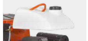
SU TANKI (İSTEĞE BAĞLI AKSESUAR)