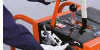
DİSKİ KALDIRMAK/İNDİRMEK İÇİN MANUEL VEYA HİDROLİK KONTROL