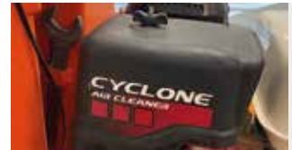
SİKLONIK HAVA FİLTRESİ