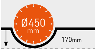
MAKS. KESME DERİNLİĞİ