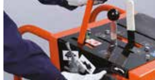
MANUEL VEYA HİDROLİK KONTROL