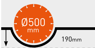
MAKS. KESME DERİNLİĞİ