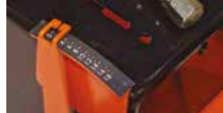
KESME DERİNLİĞİ GÖSTERGESİ