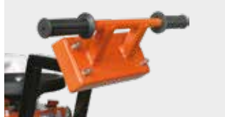
DAHA AZ TİTREŞİM İÇİN ELASTİK SÜSPANSİYONLU ŞASI VE GİDON