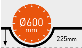
MAKS. KESME DERİNLİĞİ