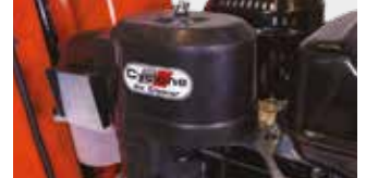
SİKLONIK HAVA FİLTRESİ