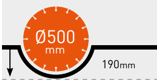
MAKS. KESME DERİNLİĞİ