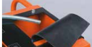
ENTEĞRE SU TANKI