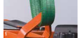
ENTEĞRE KALDIRMA HALKASI