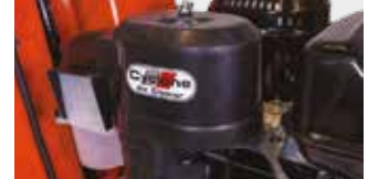
SİKLONIK HAVA FİLTRESİ