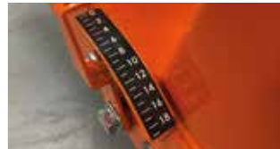
KESME DERİNLİĞİ GÖSTERGESİ