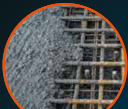
BETON BETON ZBROJONY