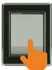
2: Čištění filtru

Stiskněte tlačítko pro nucené čištění filtru.