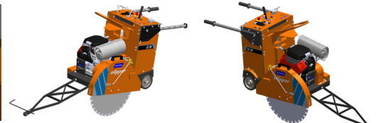
Möglichkeit der Blattaufnahme auf der rechten oder linken Seite der Maschine