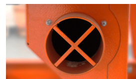
MOŻLIWOŚĆ PODŁĄCZENIA ODKURZACZA