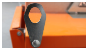
4 SKŁADANE HAKI DO PODNOSZENIA