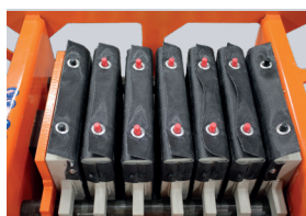
EINFACHER ZUGANG ZU DEN FILTERPLATTEN