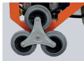
EINFACHER TRANSPORT DANK SPORNRAD