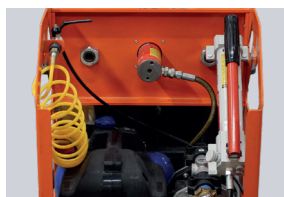
HYDRAULIKPUMPE MIT DRUCKVENTIL