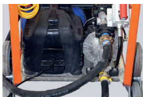
EINFACHER UND SCHNELLER ANSCHLUSS MIT FARBlichen MARKIERUNGEN