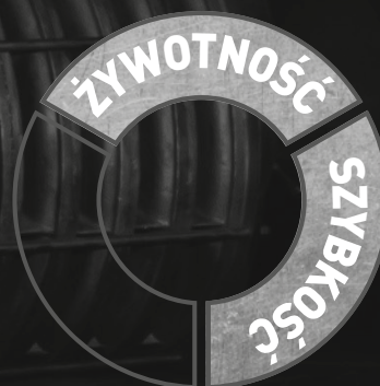
Ceramiczna tarcza konwencjonalna Norton