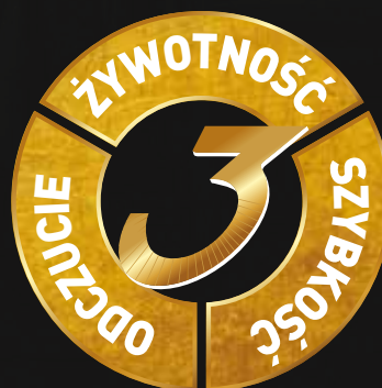
Ceramiczna tarcza Norton Quantum3