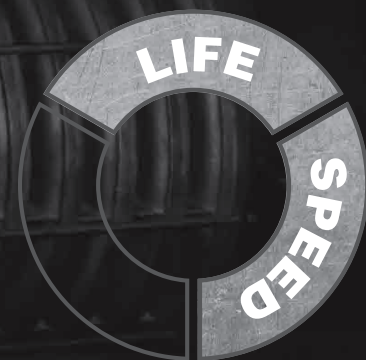
Norton Keramische schijf