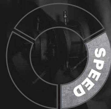
Norton Zirkonium schijf