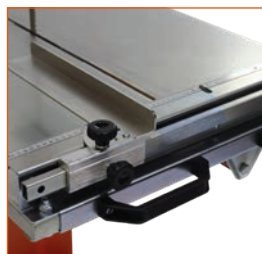
Guide de coupe