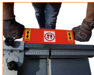
Double poignée de sécurité « homme mort »