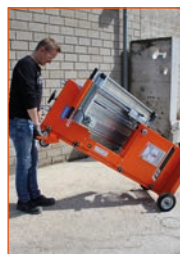
Facile à transporter