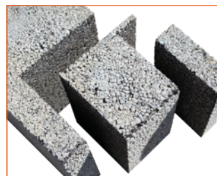
Coupe de précision