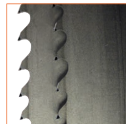
Machines livrées avec un ruban Extreme