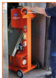
Adaptée aux petits espaces