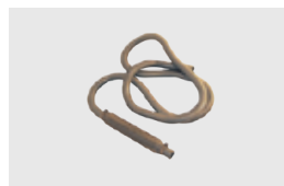
RURA DO ODPROWADZANIA SPALIN (długość: 3,3 m)