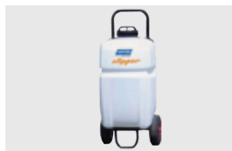
ELEKTRYCZNY ZBIORNIK NA WODĘ 35 L