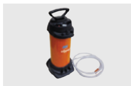
ZBIORNIK NA WODĘ 10 L