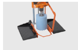
PODSTAWKI NA NOGI Z ROLKAMI