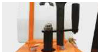
INTELIĞENTNE BLOKOWANIE GŁĘBOKOŚCI CIĘCIA