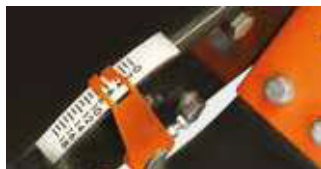
WSKAŹNIK GŁĘBOKOŚCI CIĘCIA